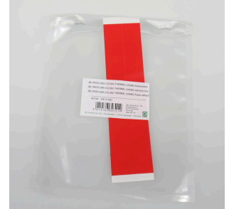
JBL PF CO2 BIO THERMAL CASING Klebestr.