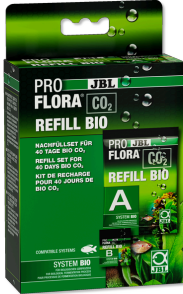
JBL PROFLORA CO2 REFILL BIO Nachfüllset für Bio- CO2- Düngeranlagen