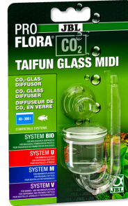
JBL PROFLORA CO2 TAIFUN GLASS Glas-CO2-Diffusor für Süßwasseraquarien von 40-300 l