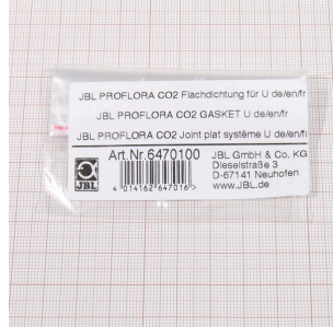
JBL PF CO2, U için düz conta