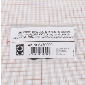
JBL PROFLORA CO2 M için O halka