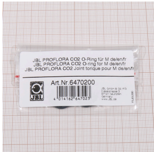
JBL PROFLORA CO2 Joint torique pour M