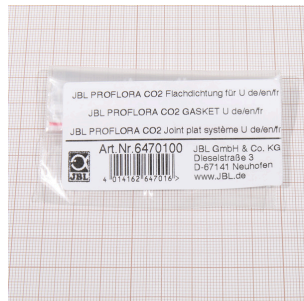
JBL PF CO2, joint plat pour U