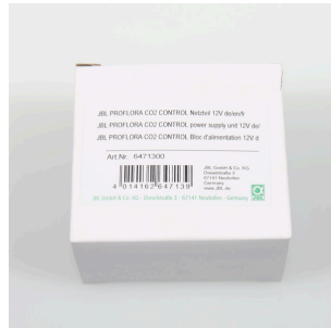
Fuente de alimentación 12V JBL PF CO2 CONTROL