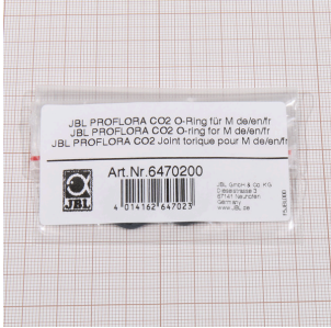
JBL PROFLORA CO2 M için O halka