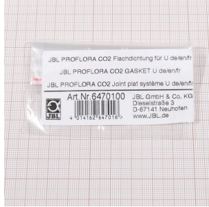
JBL PF CO2, U için düz conta