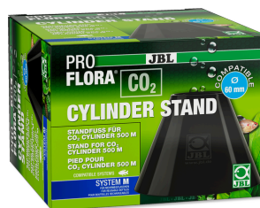
JBL PROFLORA CO2 CYLINDER STAND Podstavec na lahve 500 g CO2