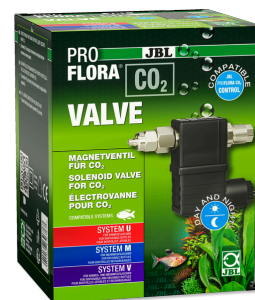
JBL PROFLORA CO2 VALVE CO2 magn. ventil pro kontrolu přívodu CO2