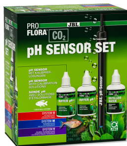
JBL PROFLORA CO2 pH SENSOR SET pH elektroda v lab. kvalitě pro pH přístroje