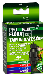
JBL PROFLORA CO2 TAIFUN SAFESTOP Pojistka proti zpětnému toku pro zařízení CO2