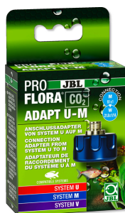
JBL PROFLORA CO2 ADAPT U - M Adaptér pro přestavbu jednor. lahvi CO2 na plnitelné