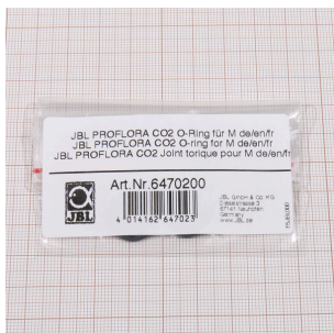
JBL PROFLORA CO2 O kroužek pro M