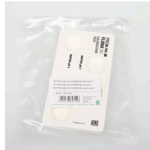
JBL PF CO2 CALIBRATION tray Voor een stabiele positionering van de cuvetten