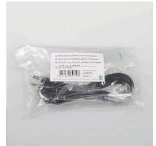
JBL PF CO2 CONTROL kabel voor VENTIEL