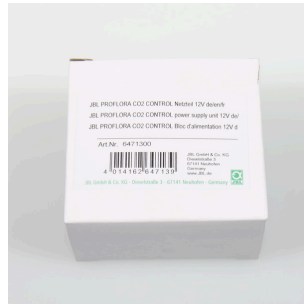
JBL PF CO2 CONTROL voeding 12V