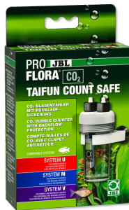
JBL PROFLORA CO2 TAIFUN COUNT SAFE Contabolle CO2 con valvola di non ritorno integrata