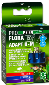
JBL PROFLORA CO2 ADAPT U - M Adattatore per bombole CO monouso/ricaricabili