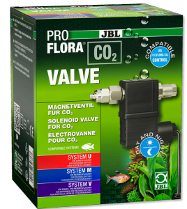
JBL PROFLORA CO2 VALVOLA Valvola magnetica per un apporto controllato di CO2