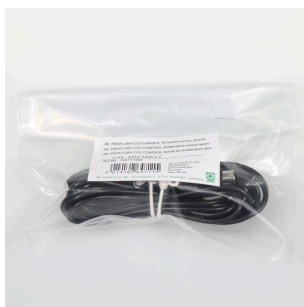
JBL PF CO2 CONTROL sensore di temperatura