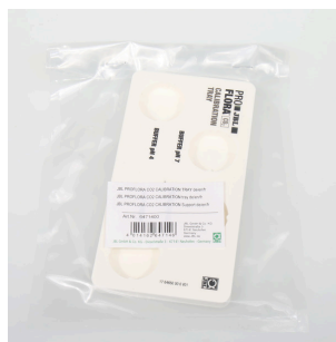
JBL PF CO2 CALIBRATION portaprovette Solido appoggio delle provette durante la calibratura