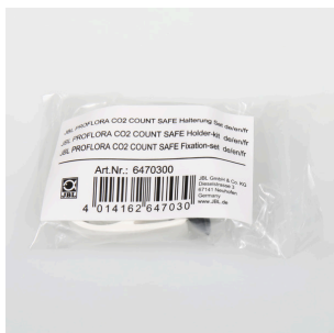
JBL PF CO2 COUNT SAFE крепление в компл.