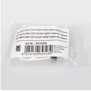
JBL PF CO2 COUNT SAFE askı seti