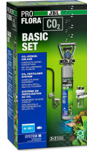
JBL PROFLORA CO2 BASIC SET M Akv. bitkileri için komple temel CO2 gübr. cihazı seti