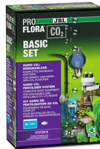
JBL PROFLORA CO2 BASIC SET V Akvaryum bitkileri için TÜPSÜZ CO2 gübreleme cihazı