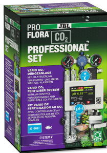
JBL PROFLORA CO2 PROFESSIONAL SET V CO2 kumandalı CO2 bitki gübreleme cihazı/TÜP HARIÇ