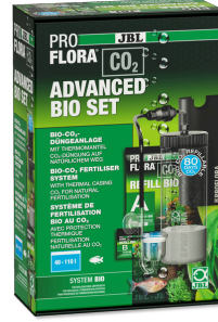
JBL PROFLORA CO2 ADVANCED BIO SET 40-110 l'lik tatlı su akv. için Bio- CO2 gübr. cihazı