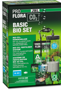
JBL PROFLORA CO2 BASIC BIO SET 40-80 l'lik tatlı su akvary. için Bio-CO2 gübr. cihazı