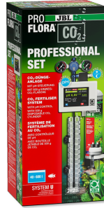
JBL PROFLORA CO2 PROFESSIONAL SET U Komple CO2 bitki gübr. cihaz seti + CO2-pH kuman. cih.