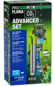
JBL PROFLORA CO2 ADVANCED SET M Komple CO2 bitki gübr. cih. seti + gece kapa. düzeneği