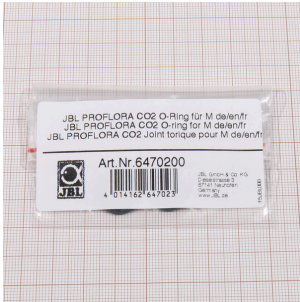
JBL PROFLORA CO2 Junta tórica para M