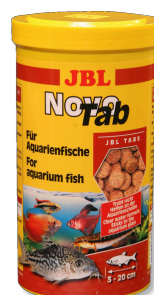
JBL NovoTab Mangime base in compresse per tutti i pesci d'acquario