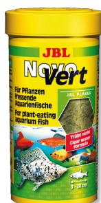
JBL NovoVert Mangime di base: flocchi per pesci d'acquario erbivori