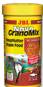
JBL NovoGranoMix Mangime di base per pesci d'acquario medi e grandi