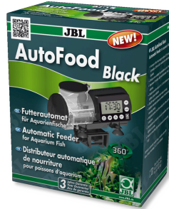
JBL AutoFood BLACK Comedero automático negro para peces de acuario