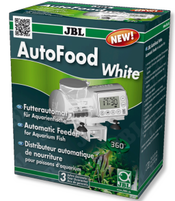
JBL AutoFood WHITE Comedero automático blanco para peces de acuario