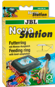
JBL NovoStation Comedero flotante con compensador del nivel del agua