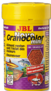
JBL NovoGranoColor mini

Gránulos para peces de acuario pequ. con colores vivos