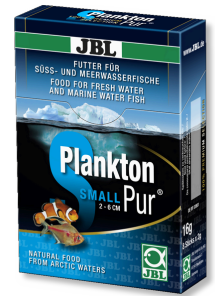
JBL PlanktonPur SMALL Küçük akvaryum balıkları için atıştırma