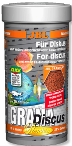
JBL GranaDiscus Diskus için granül şeklinde birinci kalite temel yem