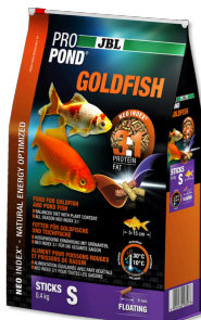
JBL PRO POND GOLDFISH S Voedingssticks voor kleine goudvissen