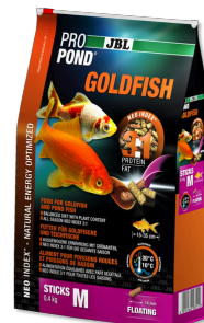
JBL PRO POND GOLDFISH M Voedingssticks voor middelgrote tot grote goudvissen