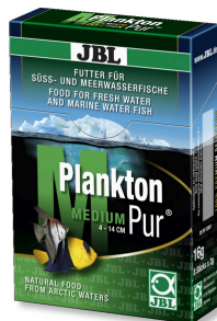
JBL PlanktonPur MEDIUM Leckerbissen für große Aquarienfische