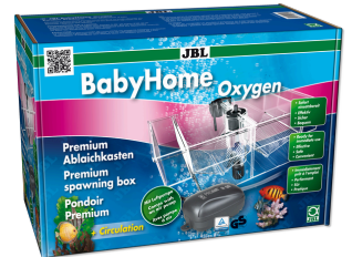
JBL BabyHome Oxygen Premium-Abiaichkasten- Komplettset mit Luftpumpe