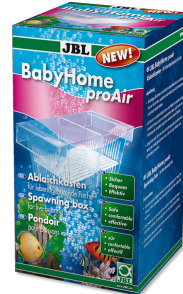
JBL BabyHome proAir Abiaichkasten für Sprudelsteininstallation