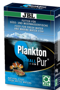
JBL PlanktonPur SMALL Leccornie per i piccoli pesci d'acquario