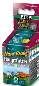
JBL NanoCrabs Mangime di base per Cambarellus