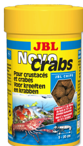
JBL NovoCrabs Mangime base a scaglie per crostacei