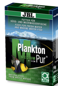
JBL PlanktonPur MEDIUM Leccornie per grossi pesci d'acquario