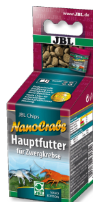
JBL NanoCrabs Pokarm podstawowy dla raczków karłowatych