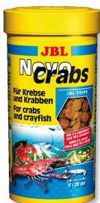
JBL NovoCrabs Pokarm podstawowy w chipsach dla raków