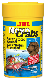
JBL NovoCrabs Voederchips voor kreeften