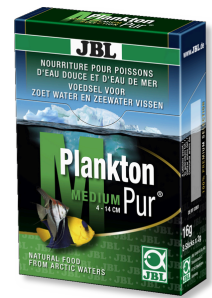
JBL PlanktonPur MEDIUM Lekkerrij voor grote aquariumvissen