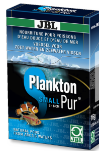
JBL PlanktonPur SMALL Lekkerrijen voor kleine aquariumvissen