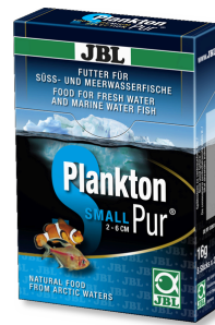
JBL PlanktonPur SMALL Golosinas para peces de acuario pequeños