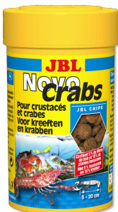
JBL NovoCrabs Alimento básico en pastillas para crustáceos