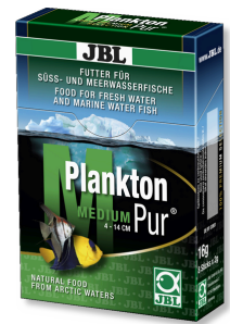
JBL PlanktonPur MEDIUM Golosinas para peces de acuario grandes