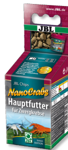
JBL NanoCrabs Aliment de base pour écrevisses naines