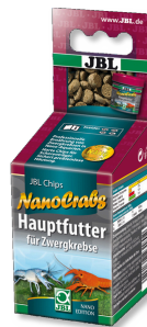
JBL NanoCrabs Manigme di base per Cambarellus