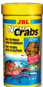
JBL NovoCrabs Pokarm podstawowy w chipsach dla raków