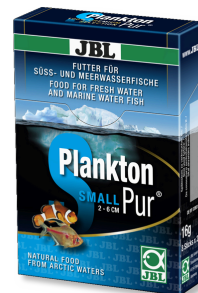
JBL Plankton Pur SMALL Petisco para peixes pequenos de aquário