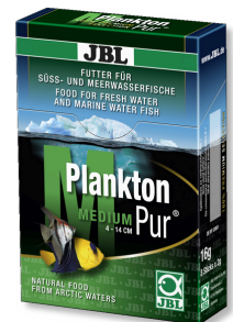
JBL Plankton Pur MEDIUM Petisco para peixes grandes de aquário