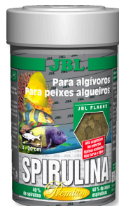
JBL Spirulina Alimento princi. premium p/ comed. de algas no aquário