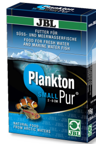
JBL PlanktonPur SMALL

Küç. akv. bal için granül şekl. birinci kal. tem. yem