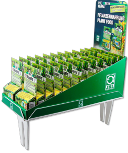
JBL Tray (tepsi) 381 x 186 x 30mm