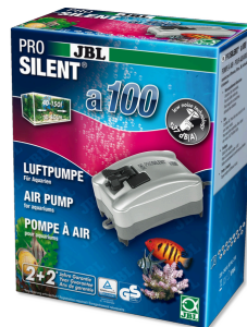
JBL PROSILENT a100 Luftpumpe für Süß- und Meerwasser-Aquarien