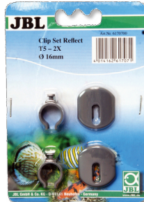
JBL SOLAR REFLECT Clip Set Halterung für Leuchtstoffröhren