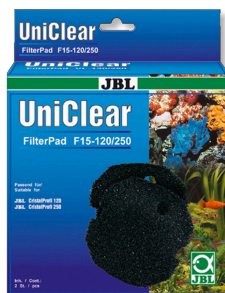
JBL FilterPad F15 Губка грубой фильтрации для CristalProfi