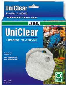
JBL FilterPad VL CristalProfi akv. filtresi için dokusuz kumaş pamuk