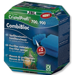
JBL CombiBloc CristalProfi e CristalProfi e için ön filtre elemanları ve sünger