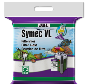
JBL Symec VL Vello d'ovatta contro tutti gli intorbidamenti