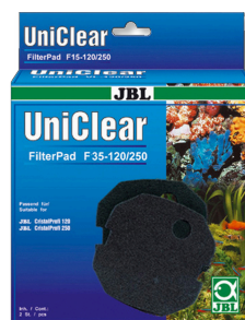
JBL FilterPad F35 Mousse fine pour filtre d'aquarium CristalProfi