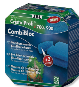
JBL CombiBloc CristalProfi e Blocs de préfiltration et mousse pour CristalProfi e