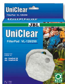
JBL FilterPad VL Ouate filtrante pour filtre d'aquarium CristalProfi