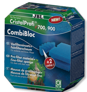
JBL CombiBloc CristalProfi e Cartuchos pré-filtrantes e espuma para CristalProfi e