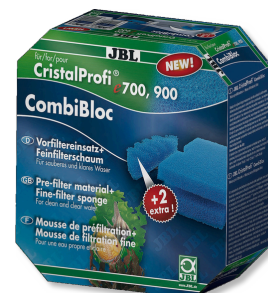
JBL CombiBloc CristalProfi e Вставка префильтра и губка для CristalProfi e