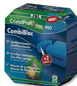
JBL CombiBloc CristalProfi e Předfiltr, vložky a pěnový materiál pro CristalProfi e