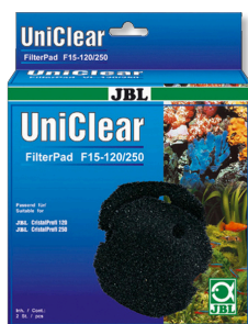
JBL FilterPad F15 Hrubá pěnová podložka pro akvárijní filtr CristalProfi