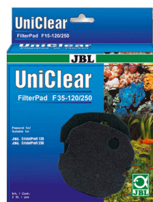
JBL FilterPad F35 Jemný pěnový materiál pro Filter Cristal Profi