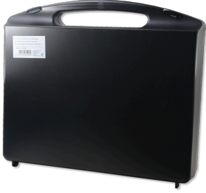
JBL Testlab, boş + yuvalar