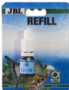
JBL pH 3,0-10,0 test Sneltest voor het bepalen van het zuurgehalte