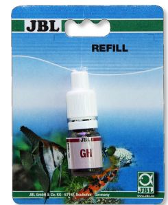
JBL Test GH Test rapide pour déterminer la dureté totale