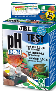
Test JBL pH 6,0-7,6 Test de pH para acuarios de agua dulce entre 6,0-7,6