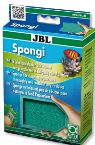
JBL Spongi Esponja de limpieza para acuarios y terrarios