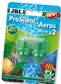
JBL ProSilent Aeras Micro S2

Pietre porose per bollicine fini nell'acquario