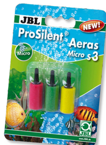
JBL ProSilent Aeras Micro S3

Pietre porose per bollicine fini nell'acquario