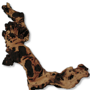
X JBL Mopani Kořen pro akvária a terária