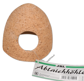
JBL keramická jeskyňka Keramická jeskyňe pro sladkovodní akvária.