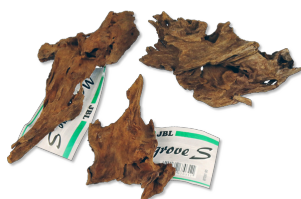
JBL Mangrove Kořen mangrovniku pro akvária a terária