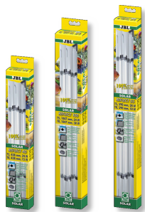
JBL SOLAR Reflect T5/ T8 - 895-1500 mm Lámina reflectora para tubo fluorescente solar