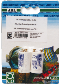
JBL Start Solar Cebador para tubos fluorescentes T8