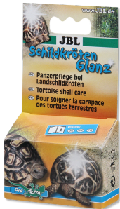
JBL Schildkrötenglanz Panzerpflege für Landschildkröten