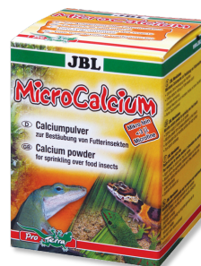
JBL MicroCalcium Mineralien-Ergänzungsfutter für alle Reptilien