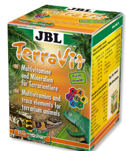
JBL TerraVit Vitamine und Spurenelemente für Terrarientiere