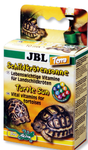
JBL Schildkrötensonne Terra Vitamine für Landschildkröten