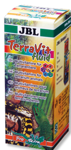
JBL TerraVit fluid Vitamine und Spurenelemente für Terrarientiere