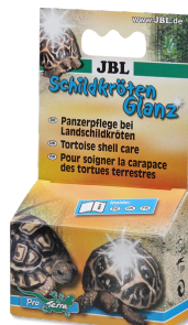
JBL Средство для ухода за панцирем у черепах

Препарат для ухода за панцирем сухопутных черепах