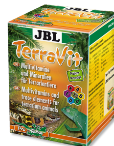
JBL TerraVit Powder Vitamíny a stopové prvky pro terarijní zvířata