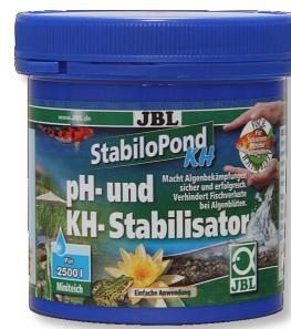
JBL StabiloPond KH Stabilizzatore pH per laghetti da giardino