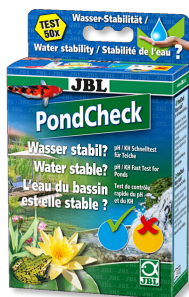
JBL PondCheck Test rapido per determinare i valori di pH e KH