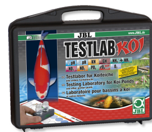
JBL Testlab Koi Чемоданчик с профессиональными тестами для пруда с кои