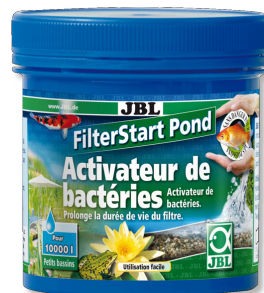
JBL FilterStart Pond Activateur de bactéries pour filtre de bassin